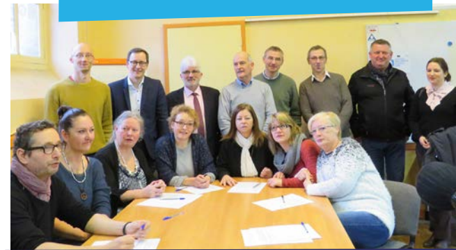
Signature des contrats des premiers salariés de TEZEA

Tout est à faire, et c'est aussi ce qui motive !