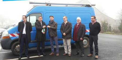
Enedis donne un véhicule à TEZEA

miques et associatifs, salariés de TEZEA, structures d'insertion par l'activité économique, institutions, syndicats.